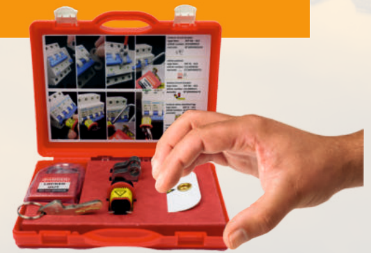
SEP Lock-out box